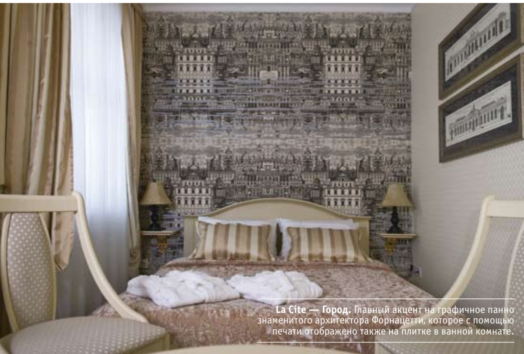
La Cite — Город. Главный акцент на графичное панно знаменитого архитектора Форнацетти, которое с помощью печати отображено также на плитке в ванной комнате.

La Cite — Город. Номер создан для ценителей городского стиля. Главный акцент на графичное панно знаменитого архитектора Форнацетти, которое с помощью печати отображено также на плитке в ванной комнате. Уютные нотки вносит золотисто-бежевый текстиль кровати и штор.