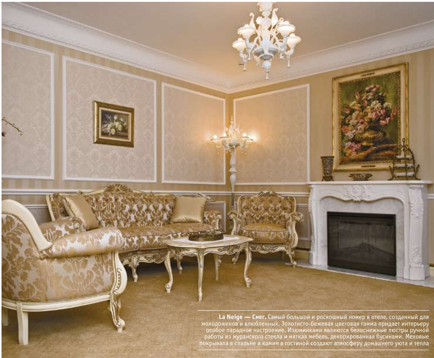
La Neige — Снег. Самый большой и роскошный номер в отеле, созданный для молодоженов и влюбленных. Золотисто-бежевая цветовая гамма придает интерьеру особое парадное настроение. Изюминками являются белоснежные люстры ручной работы из муранского стекла и мягкая мебель, декорированная бусинами. меховые покрывала в спальне и камин в гостиной создают атмосферу домашнего уюта и тепла