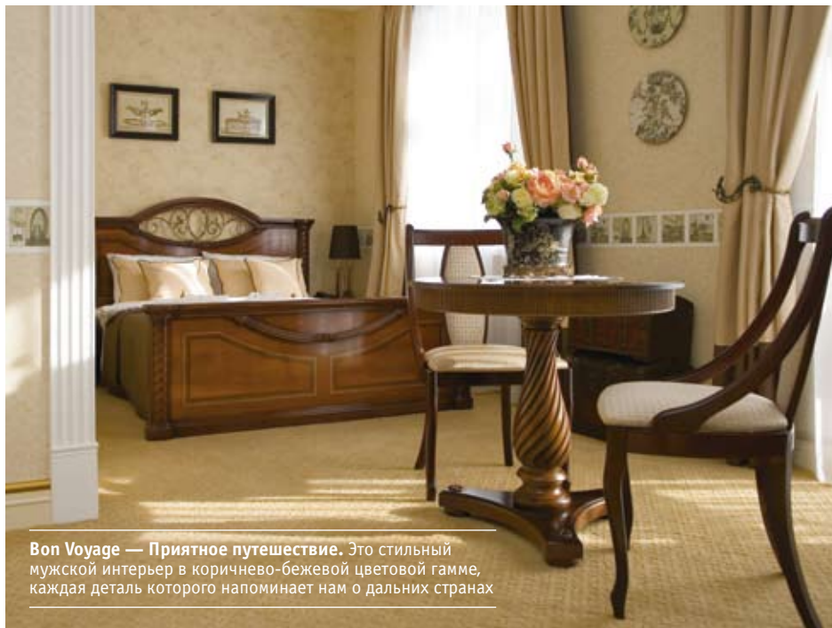
Von Voyage — Приятное путешествие. Это стильный мужской интерьер в коричнево-бежевой цветовой гамме, каждая деталь которого напоминает нам о дальних странах

орнаментами ковер, на фоне которого переливающейся оливковой обивкой выделяется мебель.