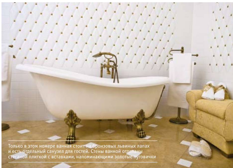
Только в этом номере ванная стоит на бронзовых львиных лапах и есть отдельный санузел для гостей. Стены ванной отделаны стеганой плиткой с вставками, напоминающими золотые пуговички