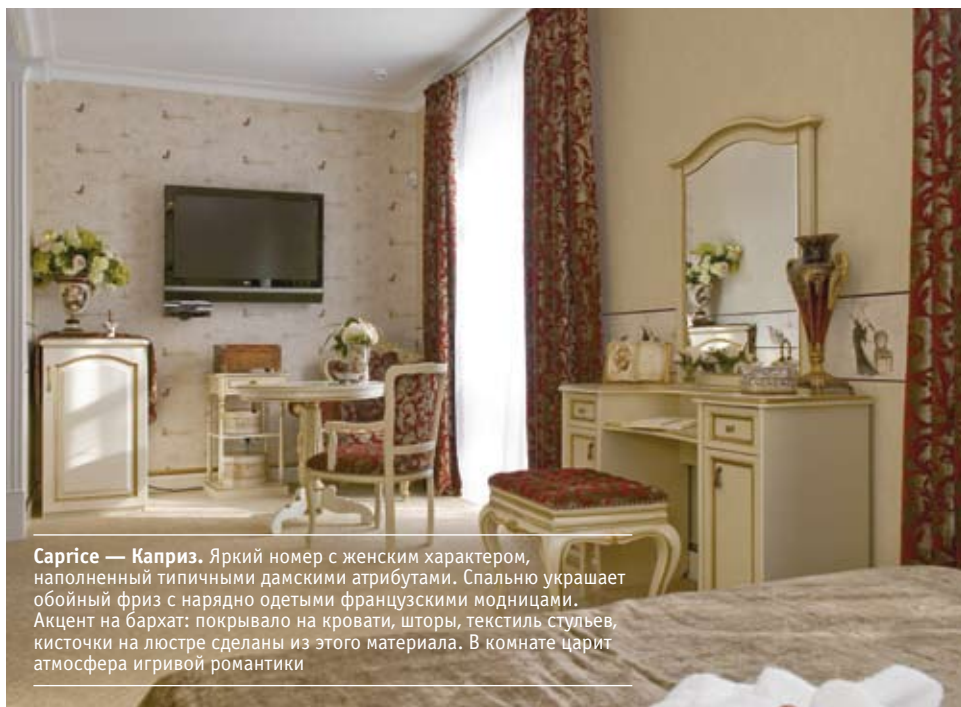
Sarprice — Каприз. Яркий номер с женским характером, наполненный типичными дамскими атрибутами. Спальню украшает обойный фриз с нарядно одетыми французскими модницами. Акцент на бархат: покрывало на кровати, шторы, текстиль стульев, кисточки на люстре сделаны из этого материала. В комнате царит атмосфера игривой романтики