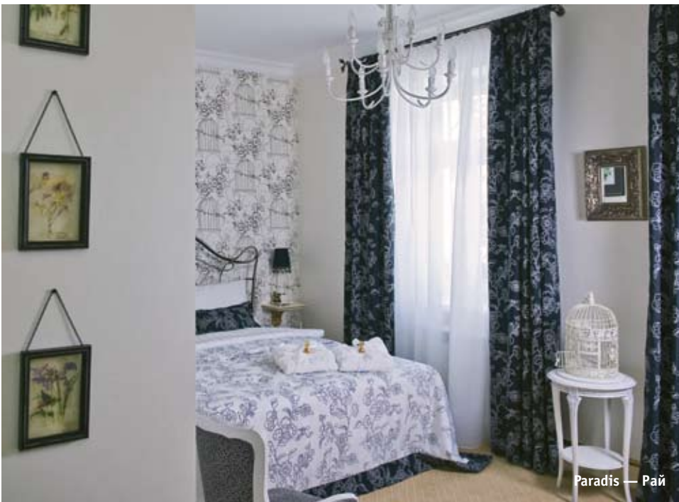
Paradis — Рай

Paradis — Рай. Основная идея интерьера — сочетание мужского и женского начала, инь и ян, отсюда и цветовое сочетание — черного и белого. Яркие детали — распахнутые клетки и свободные птицы, которые украшают тумбочки в виде статуэток и отображаются на обояном панно. Все это символизирует любовные отношения на свободе и создает непередаваемую романтическую атмосферу.