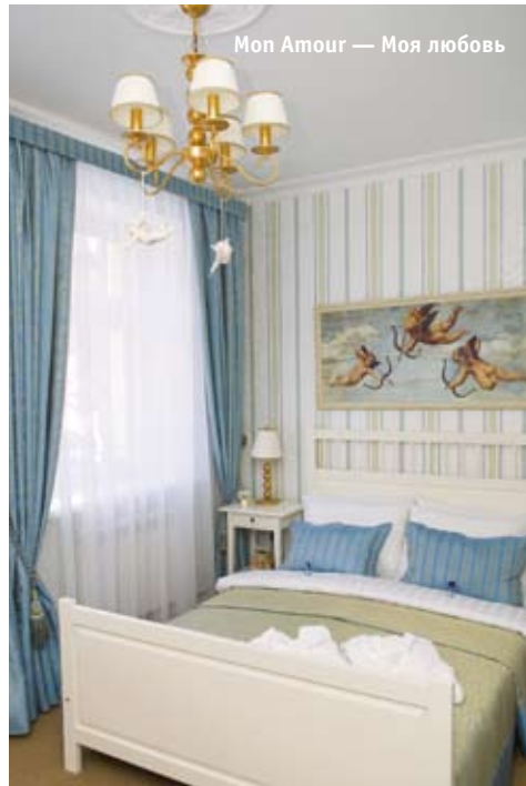
Mon Amour — Моя любовь