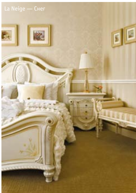
La Neige — Снег